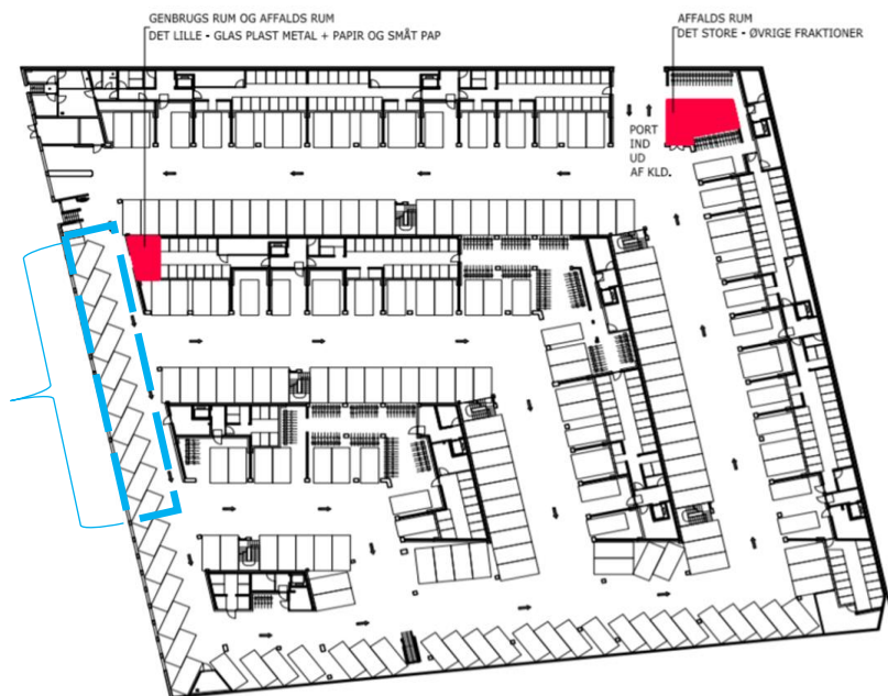
Ladestandere på blå skråparkeringspladser nr. 21-31

Du kan finde information om de etablerede ladestanderne samt hvordan du kan betale for ladning her Ladestandere , og på billedet herunder, kan du se, hvor du finder pladserne.